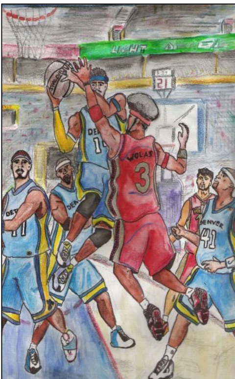
▲ Победата - съвкупност от действия на всички състезатели

а най-вече в колективните спортове. Тук победата е съвкупност от действия на всички състезатели. Те трябва да имат доверие един в друг, а за да спечелиш доверието на останалите, трябва да докажеш личните си качества. Да си способен да поемаш отговорност и да довеждаш отбора до победата. Уменията на състезателите и отработеното на тренировка имат стойност само ако бъдат показани навреме на състезания в ограничен период от време. Победата трябва да се постигне тук и сега или усилията на колектива са били напразни. Работата на спортистите и техните треньори е насочена към това, всеки състезател да може да поеме отговорността в даден момент, да направи последно лично усилие, за да донесе общата победа.