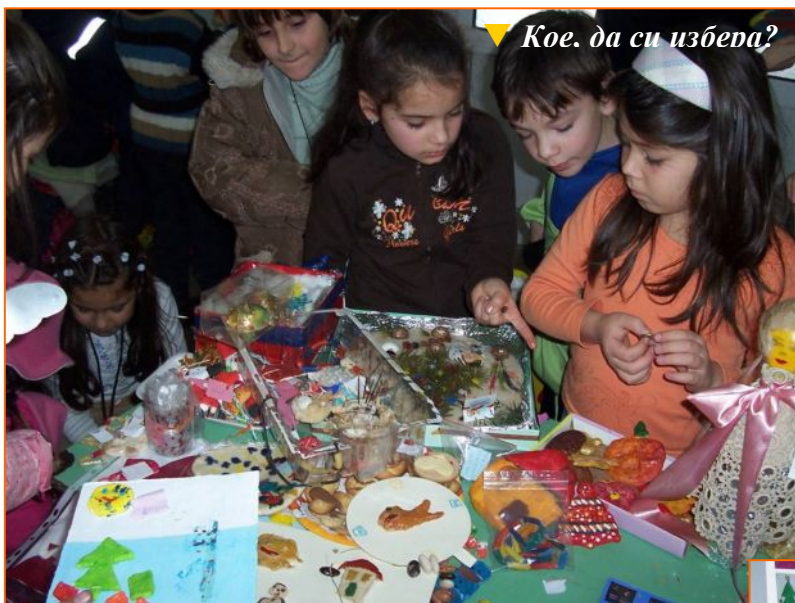
Кое да си избира?

Учениците от 5.клас, още първият ден разпродоха своите вкусотии и се наложи отново да произведат кулинарни вълшебства. Посетителите базара с интерес разглеждаха изложбата в училището. (ВЕСТИ+)