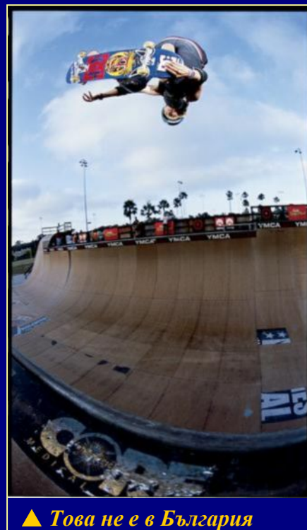
▲ Това не е в България

Някой хора още помним как след дълго чакане пред общината най-накрая някой се сеща, че едни деца седят на студа.