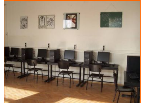
▲ 4-тия компютърен кабинет

За матурите там въобще не говорят – това си е практика в тези страни, те го правят от десетилетия. Там считат, че външните резултати не са толкова важни. Наблгат на 8-те ключови компетенции, с които се очаква да излезе един ученик от училището