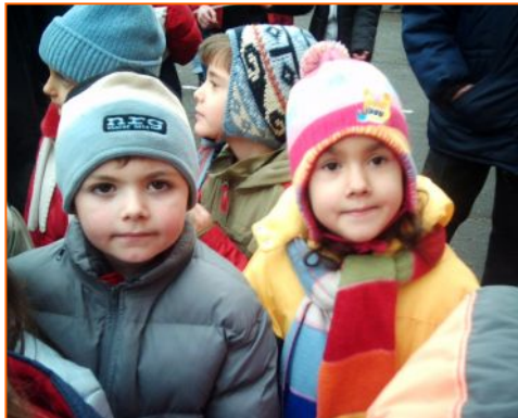
▲ Снимка на децата от 51. СОУ бе публикувана в „Аз Буки“

- Страхилище ли е инспекторът в европейските училища?