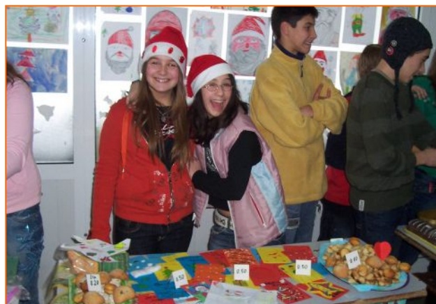
Много настроение имаше по щандовете на класовете