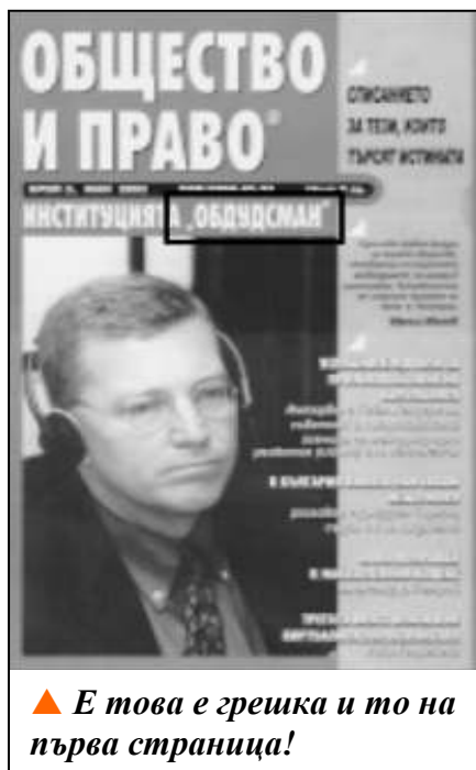
▲ Е това е грешка и то на първа страница!

Въпросът с грешките е следствие от един далеч по-сериозен проблем – грамотността на българчетата. Парадоксално е, че те печелят първите места по френски правопис (нещо действително трудно, като се има предвид че във френския са запазени средновековни форми), а на родния си език допускат елементарни грешки. Което веднага прехвърля топката в полето на образователното министерство – текучество, учителски заплати, реформи, учебници, матури и бог знае още какво. За съжаление в крайна сметка резултатът е слаба грамотност сред завършилите основно/средно образование и все повече неграмотност в страната.